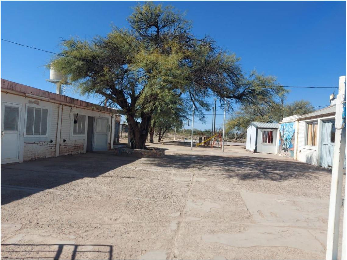
Escuela Cayé Hane. Sede Arroyito. 2020.

La disposición de las actividades y del tiempo está siempre planificada y reglada. Generalmente, las actividades comienzan con el tiempo para el aseo personal, luego se procede al desayuno. Seguidamente, empieza el momento de clases en la mañana que se extiende de las 7:00 hs. a las 13:00 hs. Cumplida esa rutina, hay un breve periodo de tiempo para prepararse para almorzar y luego se procede al almuerzo.