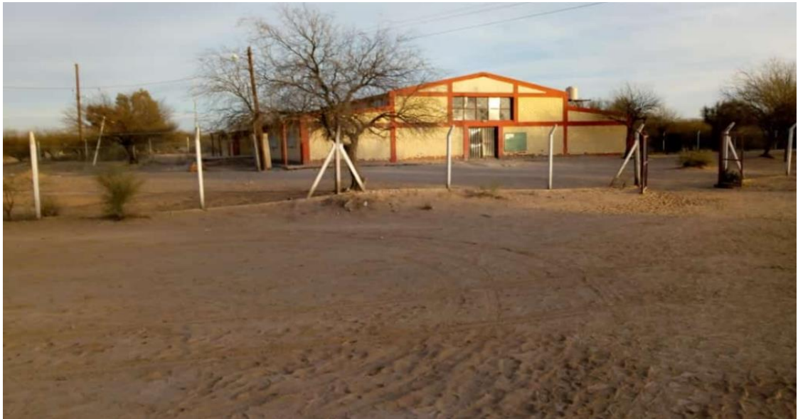
Escuela Cayé Hane. Sede San Miguel de Los Sauces. 2022.

En las siguientes fotografías de los edificios de las dos sedes de la escuela Cayé Hane pueden observarse las dimensiones de los establecimientos y las comodidades que ofrecen a estudiantes y el personal que allí se alberga.