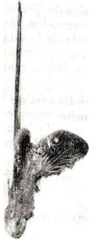
Hohenbuehelia roiyii , tamaño natural

multis aillariter currentibus, sed aliis oblique vel perpendiculariter dispositis, membranis 0,4-15 crassis, hyalinis, laxis sed haud gelatinosis, eis hymnopathii magis aillariter dispositis et generatim membrana tenuiore gaudentibus; subhymenio ex elementis brevibus exquisque constituto et bene evoluto. Tegumentis pilei ex epicute trichodermiali hyalina tomentum formante, dein, trama pilei versus duabus zonis pigmentatis (atrobrunneis, ex hyphis densis horizontalibus constitutis), inter quas zona moderatim gelatinosa