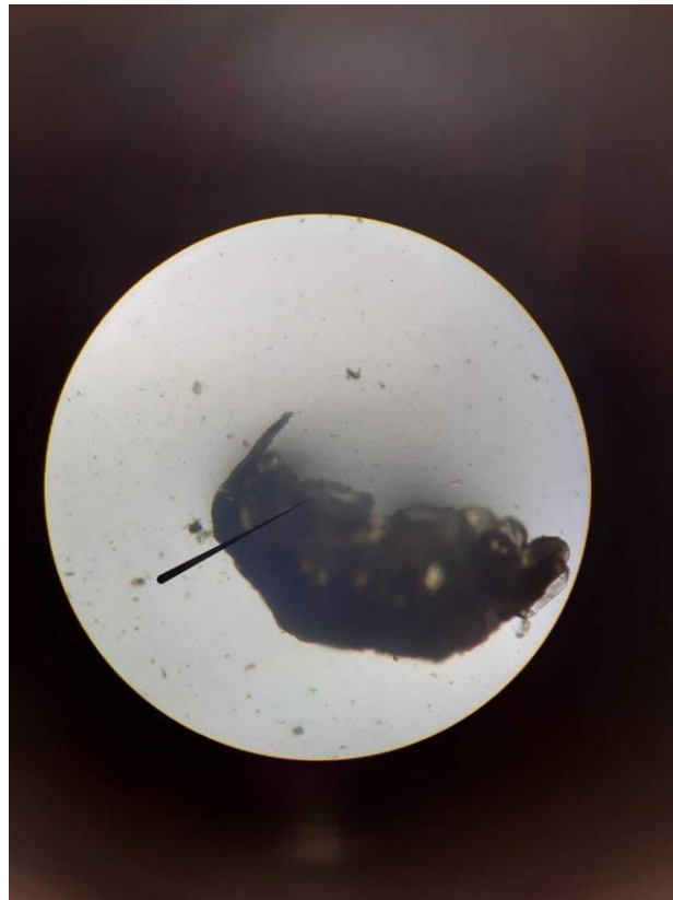
Microscopia: Ectoparásito (hembra grávida)