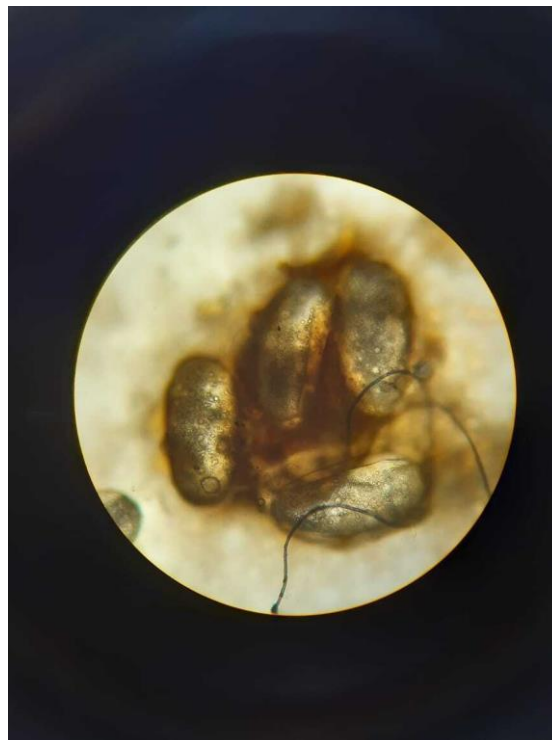
Microscopia: Huevos del parásito