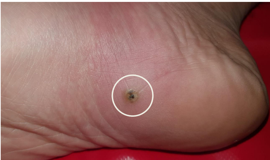
Pápula de color pardo negruzco, de 1 cm de diámetro, rodeada de halo eritematoso