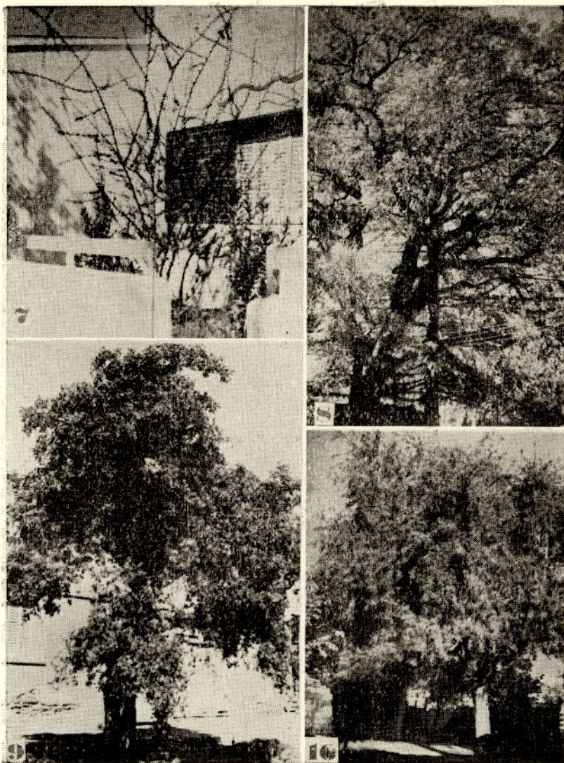
Lámina 7. Cecidium australe JOHNST.