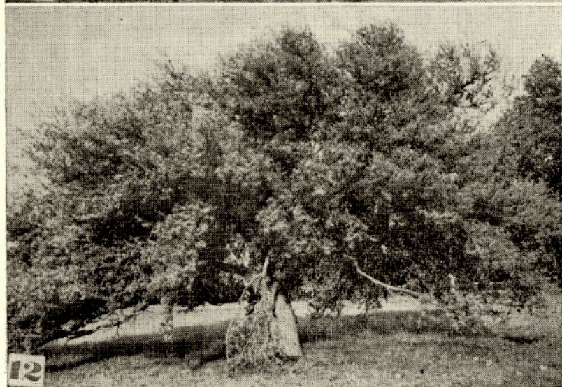
Lámina 11. Erythrina crista-galli L. al borde del lago en el Parque General San Martín.