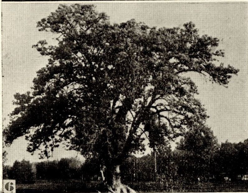
Lámina 5 Avenida de las Tipas Tipuana tipu (BENTH.) O. K. en el Parque General San Martín.