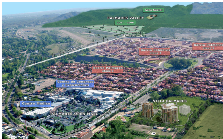
Fig. 6 Urbanización Palmares. Master Plan. 2011.