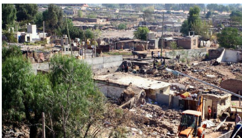
Fig. 4 Asentamiento Campo Pappa, cercano al basural a cielo abierto “El Pozo”. 2010