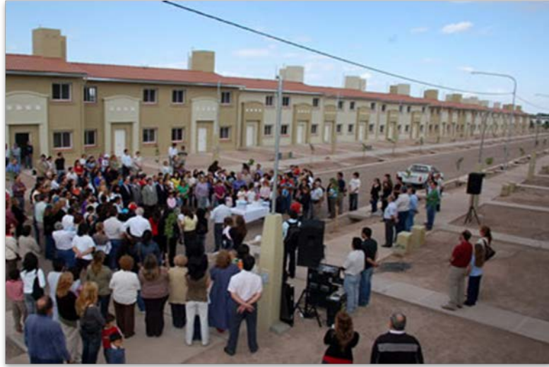
Fig. 5 Barrio “Los Libertadores”, Departamento de Maipú. 2011