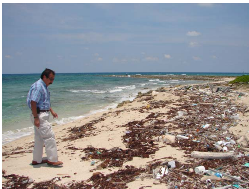
Fig. Nº 7 Contaminación en la Playa Mahahual-Xcalak, Yucatán