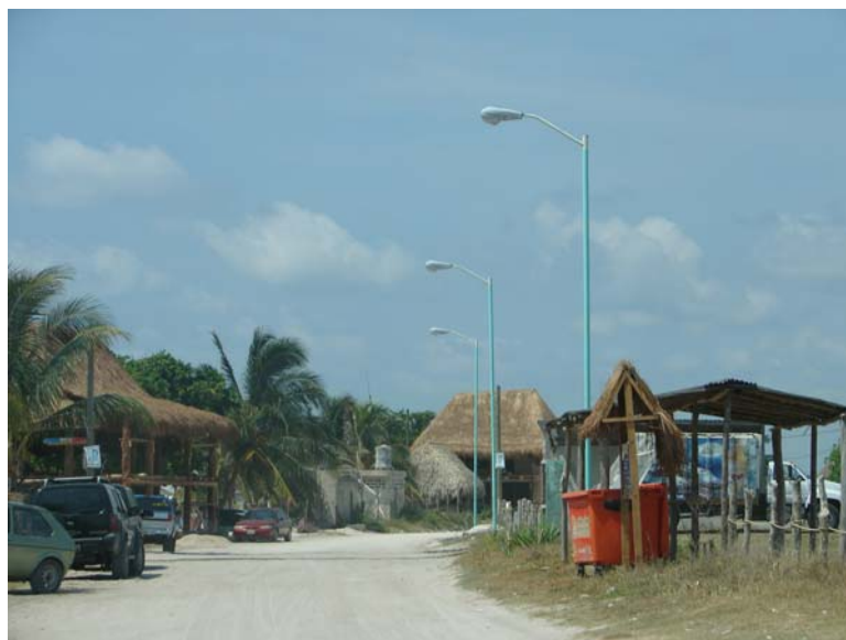
Fig. Nº 6 Localidad de Mahahual, Yucatán