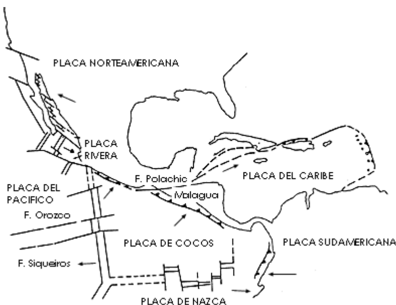
Fig. N° 1- Tectónica de Quintana Roo